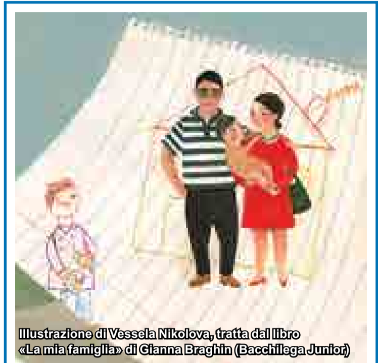
Illustrazione di Vessela Nikolova, tratta dal libro «La mia famiglia» di Gianna Braghin (Bacchilega Junior)

Verso il doppio cognome ai neonati: le valutazioni delle «nostre» assessore. Beatrice Poli e i servizi da migliorare. Intanto nel calcio le donne diventano pro